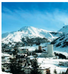
Sestrières, site olympique Turin 2006