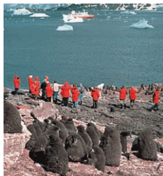
Tourisme en Antarctique