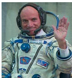
Dennis TITO, premier touriste de l'Espace