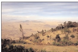
Ethiopie (hauts plateaux)