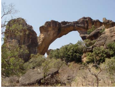
L'arche de Kamadjan à Siby

Il existe un campement privé à Siby d'une dizaine de cases avec un restaurant de plein air appartenant au député de la région, membre du comité de pilotage du projet, et qui se propose de nous vendre son campement pour notre projet.